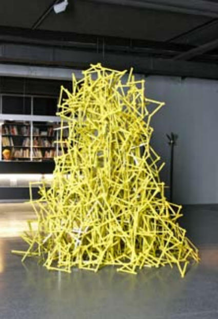
Made in Germany, 2010