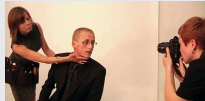
Still aus dem Video "Für Ihre berufliche Zukunft alles Gute: Ihr Gesicht ist Ihre Visitenkarte", 2010, HD-Video, PAL, 16:9, 13 min