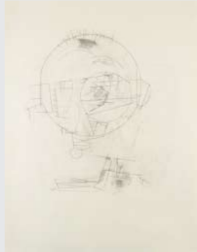
Kopf I, 2010 90 x 70 cm