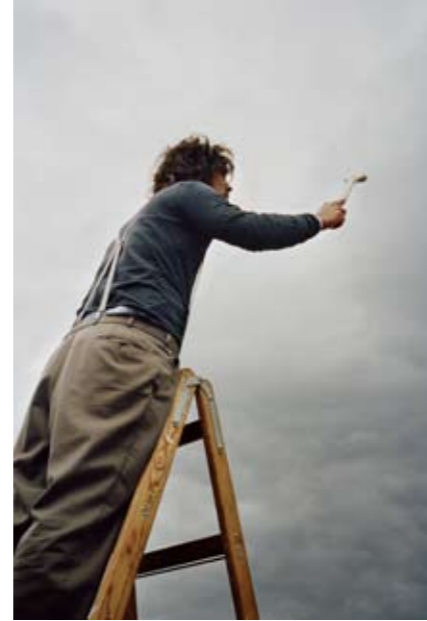
Aus der Serie „Mein natürliches Auswärts“, 2009