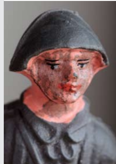
Toy Soldier 1, 2008